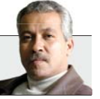
محمد الحماصي كاتب من مصر