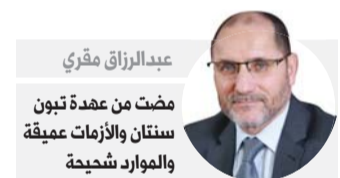
عبد الرزاق مقري مضت من عهدة تبون سنتان والأزمات عميقة والموارد شحيحة

ولئن كانت الحكومة والنواب في حلف غير ملعن قياساً بالانسجام بين مخرجات الانتخابات التشريعية وبين توجهات السلطة، فإن أجواء شبيهة بتلك التي سبقت انتفاضة أكتوبر 1988 تسود الشارع الجزائري في ظرف الراهن.