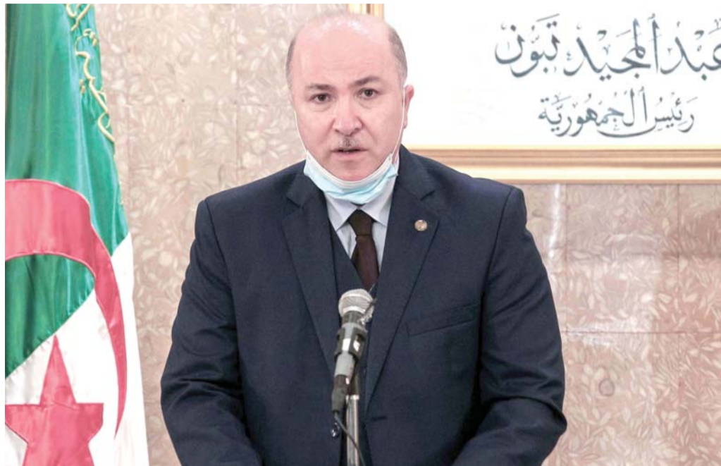
المصائب لا تأتي فرادى

التوجه إلى رفع الدعم يفاقم متاعب السلطة أمام الشارع