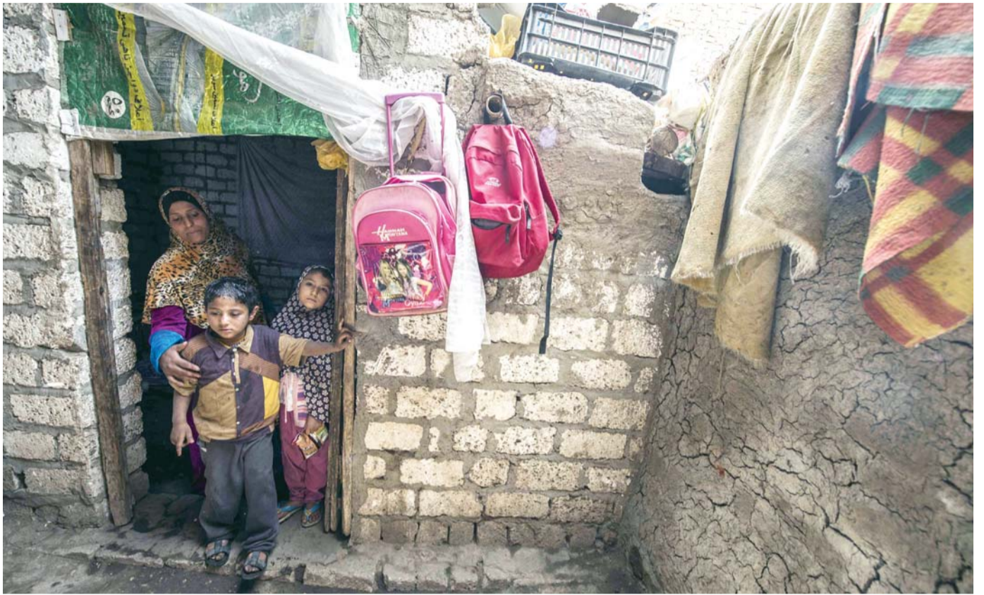
توافق توقعات الأمهات مع قدرات أطفالهن يجنبهم الانتقادات

أبنائهم، لكنها لا تحفز الطفل على التغيير، بل تزعزع ثقته بنفسه وتشعره بالدونية أمام الآخرين. ولتشجيع الأطفال على الاستماع والتعاون، تقدم الكاتبة الحاصلة على ماجستير في علم النفس أريادن بريل، في مقال لها بموقع "يوسف بارنتغ" استراتيجيات استباقية من أهمها أن تقوم الأم بشرح الحدود والقواعد بالمنزل، بعني التخلص من الكثير من المشكلات جيداً قبل أن تنمو وتؤدي بها إلى مطاردة أطفالها والصراخ عليهم. كما أن الحفاظ على الحدود يساعد الأطفال على تعلم الثقة في إرشاداتها والالتزام بها.