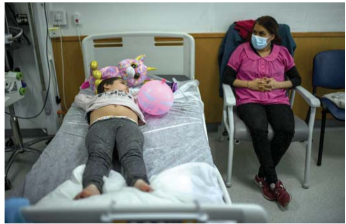
العوامل البيئية تسبب في الإصابة بسرطان الدم

وقد يؤثر تشخيص إصابة شخص بمرض ابيضاض الدم مشاعر القلق والخوف الشديدين، فيما قد تكون مهمة علاج سرطان الدم مركبة ومعقدة طبقاً لنوع سرطان الدم وتبعاً لعوامل أخرى عديدة مختلفة، في المقابل هناك طرق متنوعة وموارد كثيرة من شأنها مساعدة المريض في مواجهة اللوكيميا. ومن الممكن أن تختلف أعراض سرطان الدم من طفل إلى آخر، وتتطور ببطء، ولكن أعراض سرطان الدم الحاد يمكن أن تظهر فجأة؛ فبعض الأعراض يمكن أن يكون من السهل الخلط بينها وبين أمراض الطفولة الشائعة. وتعد الكدمات والنزيف من الأعراض التي قد تظهر على الطفل؛ فقد ينزف الطفل المصاب بسرطان الدم أكثر من المتوقع بعد إصابة طفيفة أو نزيف في الأنف. وقد تتكون لديه بقع حمراء صغيرة على الجلد واللم شديد في المعدة وفقدان الشهية وانخفاض الوزن، وذلك لأن خلايا اللوكيميا تتراكم في الطحال والكبد والكلى مما يتسبب في تضخمها في بعض الحالات.