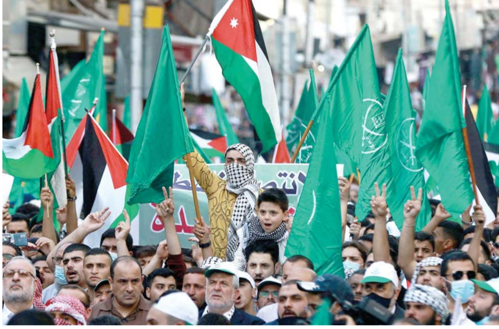
ضغوط لرأب الصدع مع حماس

الموالون لحركة حماس داخل المملكة في قلب العاصفة