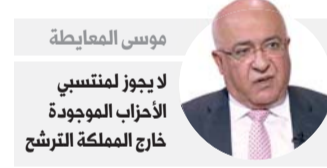
موسى المعاينة لايجوز لمنتسبي الأحزاب الموجودة خارج المملكة الترشح

وفي عام 2006 شهدت علاقة الأردن مع حماس المزيد من التوتر، حيث اتهم الأردن الحركة بتجهيز الأسلحة من سوريا إلى أراضيها. ولم يستقبل الأردن أي مسؤول من حماس منذ ذلك الوقت إلا لدواع إنسانية، وآخر استقبال تمثل في السماح لرئيس المكتب السياسي لحماس إسماعيل هنية والرئيس السابق للمكتب خالد مشعل بحضور جنازة أحد مؤسسي الحركة وأول ناطق باسمها إبراهيم غوشة الذي توفي في الأردن قبل أيام.