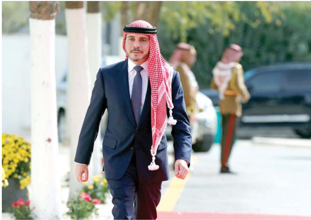
أضحكته ردود وأحزنته أخرى

ودافع مغردون عن الأمير علي. وغرد حساب الحركة النسوية في الأردن: