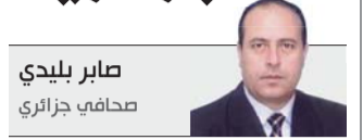
صابر بليدي صحافي جزائري

الذي أفرز القرار، تعود بأذهان المتابعين إلى حالة الضغط وتراكم الأزمات التي أربكت النخبة الحاكمة، فزيادة على متاعب الوضع السياسي الناجم عن احتجاجات الحراك الشعبي، باتت الأزمة الداخلية تستنسخ فصولها الواحد بعد الآخر. السلطة الجزائرية الجديدة التي انبثقت من عنق زجاجة منذ عامين، لم تستقر في مقعدها لاستكمال مسار بناء المؤسسات الدستورية، حتى انثرت لها أزمة مركبة انصهر فيها الأمن الإقليمي في الجنوب والشرق، بالوضع الاقتصادي والاجتماعي المقلق نتيجة تقلص المداخيل وتداعيات وباء كورونا، ثم استهداف التماسك الداخلي بخطاب الكراهية والعنصرية، فكانت قاب قوسين أو أدنى من فتنه عرقية، في أعقاب موجة غير مسبوقه من الحرائق خطط لها بشكل دقيق.