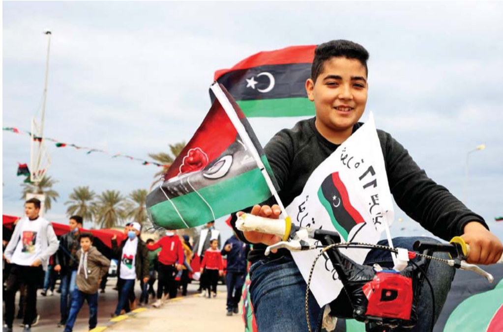
ليبيا تتجه لتأجيل الانتخابات الرئاسية رغم التأييد الشعبي لإجرائها

المقربون من رئيس الحكومة الليبية يُطرحون بالانتخابات الرئاسية