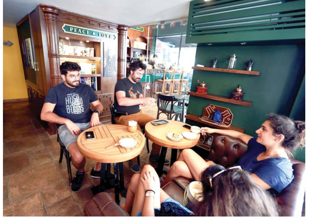
المتنفس الوحيد للبنانيين غير متاح دون لقاح

وأجريت دراسة من قبل ثلاثة من باحثي الذكاء الاصطناعي بعد انتقادات المستخدمين العام الماضي حول معانيات الصور في المنشورات التي تستغني وجوه السود.