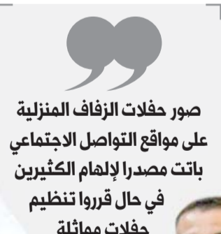
صور حفلات الزفاف المنزلية على مواقع التواصل الاجتماعي باتت مصدرا لإلهام الكثيرين في حال قرروا تنظيم حفلات مماثلة

يؤكد الخبراء على ضرورة تشجيع الضيوف على اتباع الإجراءات الاحترازية واتخاذ احتياطات استباقية بحيث يتم التواصل معهم قبل الزفاف، فتوقع سلوك الضيف أمر بالغ الأهمية للحفاظ على سلامة جميع الضيوف والمدعوين. كما ينصح هؤلاء بضرورة التأكد من تعقيم المكان والأدوات قبل وأثناء الحفل.