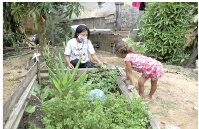
الري خلال الطقس الحار يعتمد على نوع النبات

تعدا لذلك يجب فحص نباتاتك الداخلية أكثر من المعتاد. وتوضح سببنا "لا يزال يتعين عليك سقيها عندما تحتاج الماء فقط فانت لا تريد إغراقها في تربة مبللة".