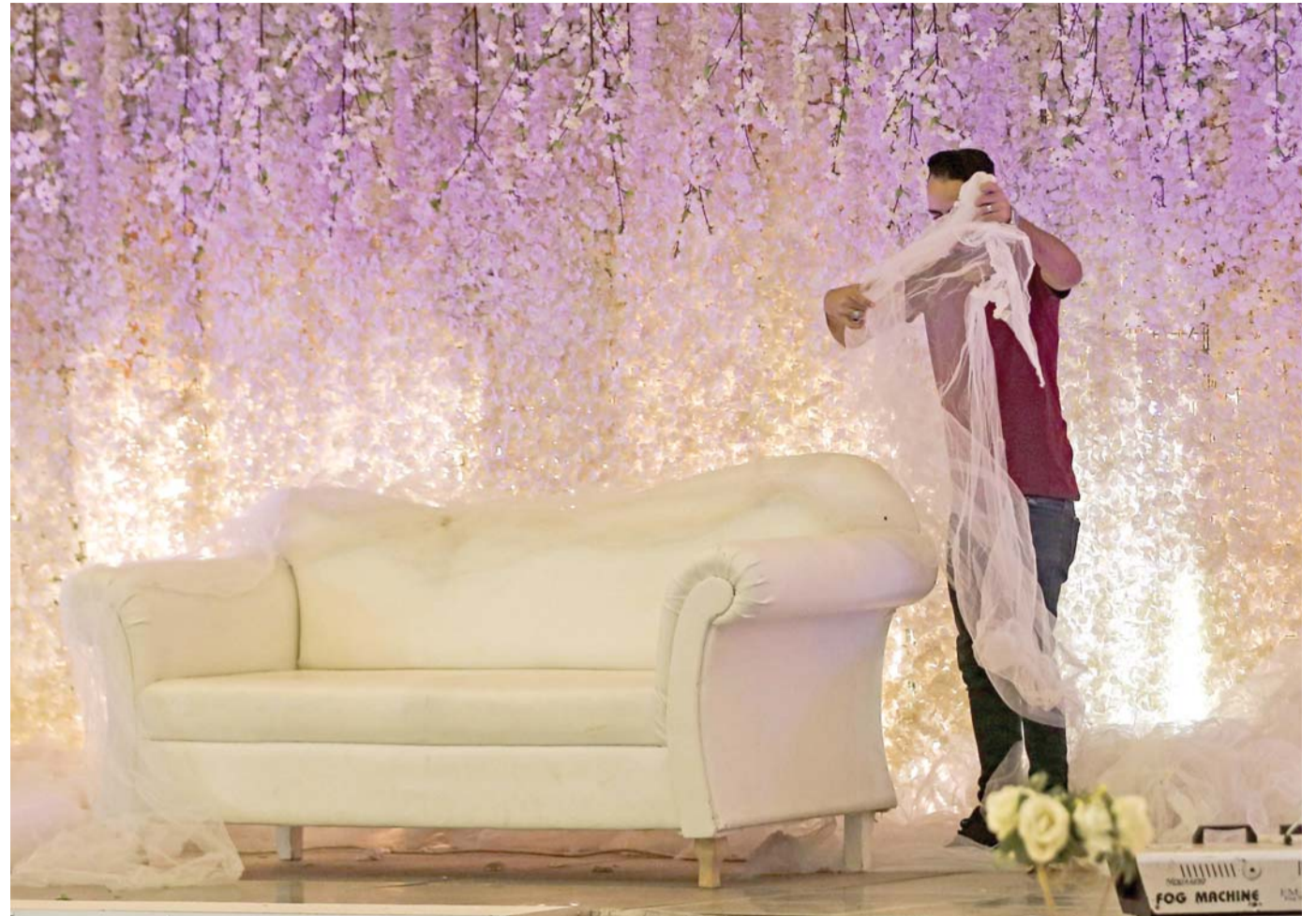
ديكور الحفلات يحدث ضيوفك عن ذوقك

وتبدو غرفة المعيشة بشكل ديناميكي وأنيق من خلال الجمع ما بين ألوان الباستيل واللون الأزرق الداكن