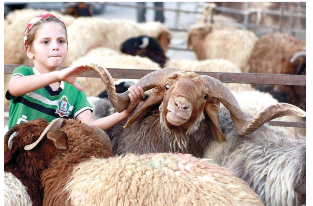
جدل يتجدد كل عام

وتصدر هاشتاغ #إقالة_وفاء_الخضرا الترند على موقع تويتر بالأردن.