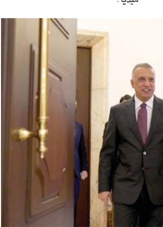
كاظمي "بليز هيلب مي"

#الولد قام بذلك لجذب انتباه المتابعين وتحقيق أكثر ما يمكن من المشاهدات، والحكومة ظنت أنها مناشدة، ولا أدري إن كانت الحكومة تريد هي أيضاً تحقيق مشاهدات والانتخاط في السوشيال ميديا.