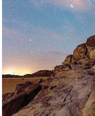
في الليل الدامس نرى النجوم قريبة

يذكر أن محافظة العلا بدأت في ضمان حماية سماء الليل المظلمة والحفاظ عليها لصالح السكان والزوار والحياة البرية، وتم تنفيذ استراتيجية لضمان تهيئة الإضاءة المناسبة للمنطقة التي تقلل وتحكم في انسكابات الضوء غير الضرورية وتقلل من تأثير الضوء الكلي.