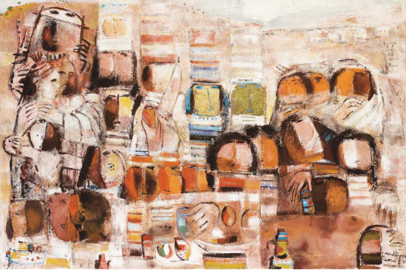
لوحات المدرس شاهد على حكايات الأرض والإنسان

فيلسوف الألوان الذي كان يخاف من الأصفر والأخضر ويتعامل معهما بحذر