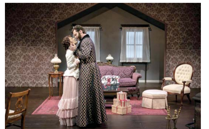
هذه النهاية عار على المسرحية الأصلية