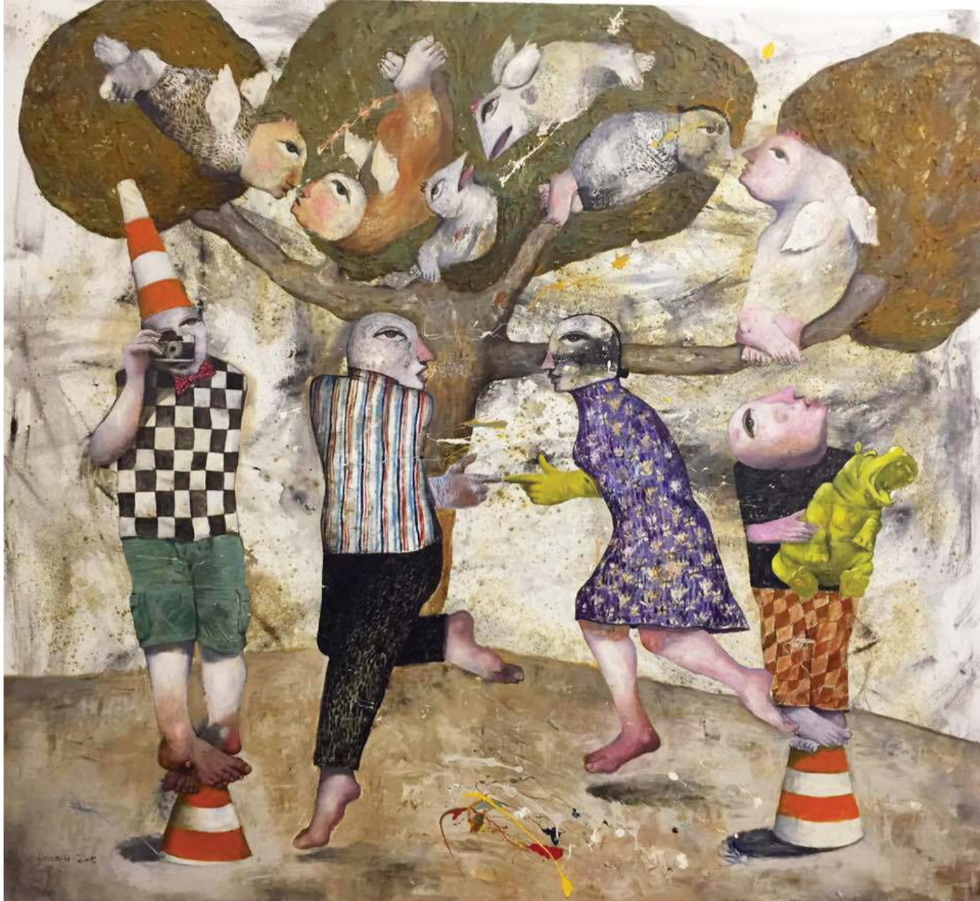
الأوهام تقود إلى نوع آخر من الإدراك (لوحة للفنان سنان حسين)