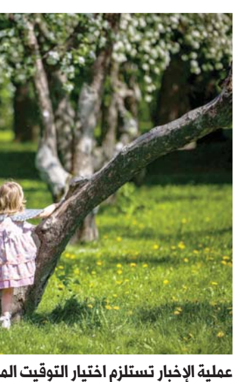
عملية الإخبار تستلزم اختيار التوقيت المناسب

وعملا بالنصيحة العامة، تقول خبيرة التعليم نيكولا شميمت إنه يجب ألا يتم إخبار الأطفال بشأن أشقايتهم المستقبلين قبل الثالثة أشهر الأولى، حيث أن احتمالية سقوط الجنين تكون مرتفعة للغاية.