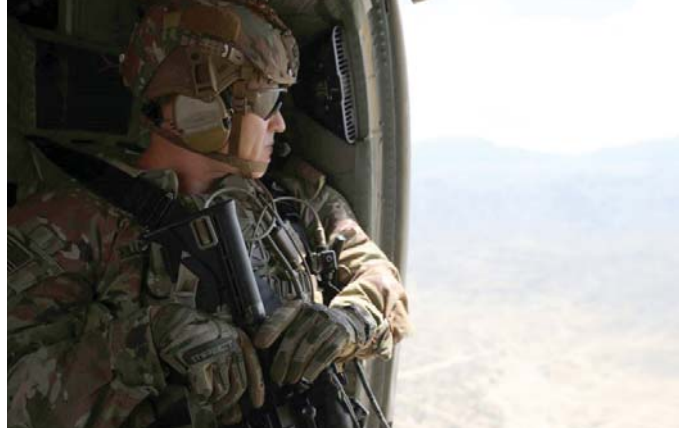
انسحب الغريون وتركوا شركاءهم في مواجهة طالبان