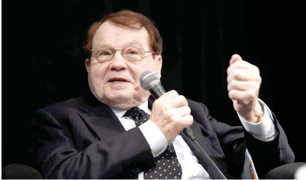
لوك مونتانييه «حطام سفينة علمية»

وقال مكتب المعلومات الصحافية التابع لوزارة الإعلام والبيت الإذاعي في الهند إن الأنواع الواردة في المنشور الذي تم تداوله على وسائل التواصل الاجتماعي