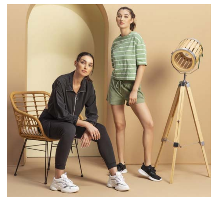
خيار مثالي للراحة والرياضة

ويبدو الرياضيون أكثر أناقة عند ارتداء لباس رياضي بلون واحد، كما يعد اللون الواحد خيارا مثاليا في صالة الألعاب الرياضية وخارجها.