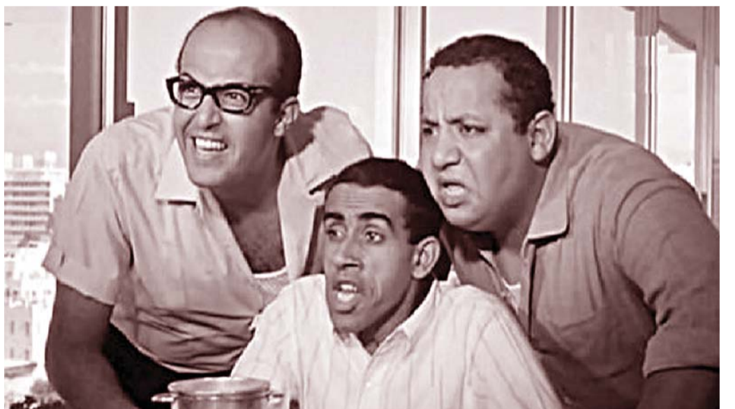
سمير غانم مثل آخر عقود من «ثلاثي أضواء المسرح»

وقدمت إثرها عددا من الأعمال الكوميدية التي لاقت نجاحا كبيرا في السينما والمسرح والإذاعة والتلفزيون، وأصبحت تلقى الدعوات من كافة الدول العربية لتقديم عروضها، كما تشارك في الحفلات الخاصة بما في ذلك المشاركة في حفل زواج منى ابنة الرئيس جمال عبدالناصر، حيث قدمت استكش «تكتور الحقني». وقال غانم في مقابلة تلفزيونية إنه عندما كان يقدم استكشات كوميدية أمام جمال عبدالناصر كان يشعر بالخوف لأن الرئيس لا يضحك رغم أنه يحب للفن، لكنه كان يضع يده على خده ويبتسم، وكان غانم يشعر بان عبدالناصر يشاهد الاستكشات لكن عقله يفكر في شيء آخر.