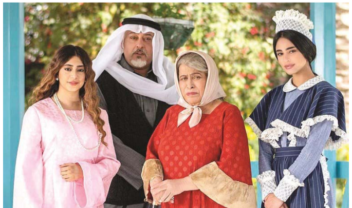
امرأة كويتية عائدة من لندن تثير أحقادا عائلية دنيئة

وهي المرة الأولى التي يتعاون فيها المخرج السوري مع حياة الفهد، أما السيناريو فكان من نصيب الكاتب الجبريني محمد شمس الذي تولى كتابة مسلسلها السابق «أم هارون».