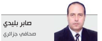
صابر بليدي صحافي جزائري

ونظمت الحكومة مؤخرا منتدى للاقتصاد الثقافي، خلص إلى جملة من التوصيات لـ "مرافقة ودعم الفنانين وحاملي المشاريع من خلال وضع البيات ودعم وتسويق الإنتاج الثقافي، وخلق بيئة ملائمة من شأنها تحفيز الاستثمار في مجالات الثقافة والفنون والسير في الصناعة الثقافية".