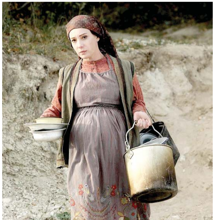
حكاية مثيرة للجدل عن تاريخ مؤلم

نقى الفنان والحكواتي العالمي ماضي صديق، في تصريح لـ "العرب"، أن تكون الهيئات الوصية مركزية كانت أو محلية، قد ساعدته في مهامه أو في حياته الاجتماعية، رغم تعلقه العالمي ونهوضه بـ "الحكاية الشعبية" كفن إنساني تستفيد منه الشعوب