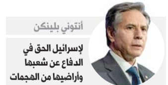
أنتوني بلينكن الدفاع عن شعبنا وأراضيها من الهجمات

القدس - تشهد الأراضي الفلسطينية تصعيدا خطيرا لاسيما في القدس الشرقية وقطاع غزة، الذي بات يتهدده اجتياح بري إسرائيلي أسوأ بعملية "الجرف الصامد" التي حدثت في العام 2014، وادت إلى دمار كبير بالقطاع فضلا عن مقتل المئات من الفلسطينيين. وتبدو مواقف المجتمع الدولي باهتة بالنسبة للفلسطينيين لاسيما الموقف الأميركي الذي ظهر منحازا لإسرائيل، حيث انتقد وزير الخارجية الأميركي أنتوني بلينكن الهجمات الصاروخية للفصائل الفلسطينية. وقال بلينكن "حتى مع اتخاذ جميع الأطراف خطوات لخفض التصعيد، فإن إسرائيل، بالطبع، الحق في الدفاع عن شعبها وأراضيها من هذه الهجمات".