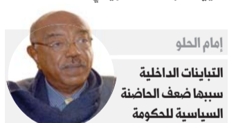
إمام الحلو التباينات الداخلية سببها ضعف الحاضرة السياسية للحكومة

وأشار الحلو إلى أن المبادرة تعيد التأكيد على الأسس السلمية التي توافقت عليها القوى الوطنية قبل إقرار الوثيقة الدستورية، وهي تعالج المستجدات التي طرأت بعد إقرارها، على أن تشكل تلك النخبة دعما لشركاء المرحلة الانتقالية من المدنيين والعسكريين والحركات المسلحة، وتدعم إنجاز مهامها، وفي القلب منها تعيين المجلس التشريعي.