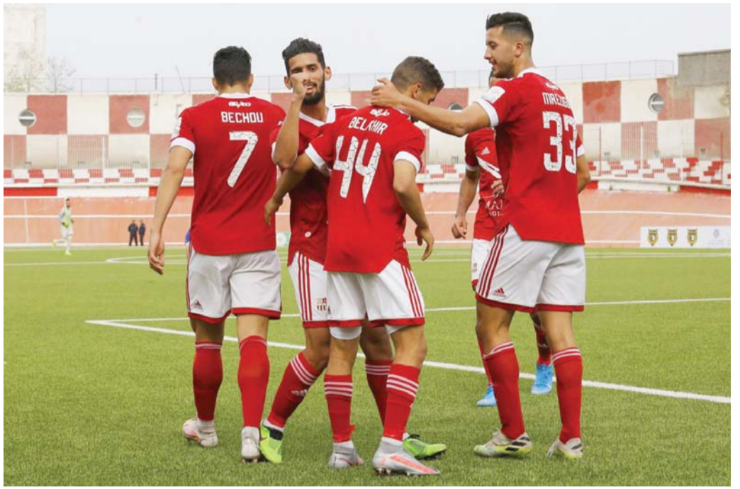
الأرقام في ارتفاع

وعاش المدرب الصربي، فترة صعبة لأنه لم يجد الوقت الكافي لإعادة بناء الهلال وصنع التجانس بين لاعبيه الجدد والقدامى. وكان زوران قد تمتع بفرصة إقامة معسكر قصير في مصر لمدة أسبوعين، في وقت كان يحتاج إلى شهر ونصف الشهر للوقوف على قدرات اللاعبين.