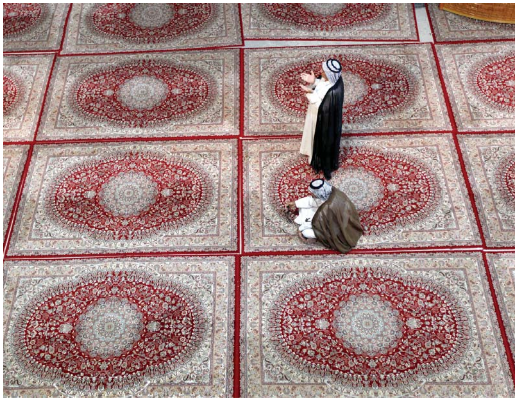
عراقيان ينتظران أداء الصلاة في مسجد القصيم بمدينة الحلة العراقية خلال شهر رمضان المبارك

وقال جولياني إنه لم يحدث أي شيء غير لائق. وحصل فيلم (إسوليوت بروف) "الدليل المطلق" من إخراج مايك ليندل الرئيس التنفيذي لشركة ماي بيلو على