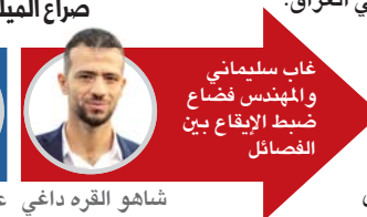
غاب سليمانى والمهندس فضاء ضبط الإقلاع بين الفصائل