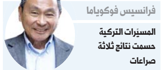
فرانيس فوكوياما المسيرات التركية صنعت نتائج ثلاثة صراعات

وقدمت تركيا نفسها كحلم لقطر في وقت تصاعدت فيه الضغوط الإقليمية على الدوحة لتغيير موقفها المهدد للاستقرار في الشرق الأوسط وشمال أفريقيا، وهو الأمر الذي قاد إلى مقاطعة من دول تتقدمها السعودية. وشهدت العلاقة بين الدوحة والرياض بعض الانفراج بعد قمة العلا السعودية، وترتب على ذلك تراجع في حدة الانتقادات المتبادلة ونتائج غير مباشرة في تخفيف حدة المواجهة بين تركيا ومصر. وترأهت تركيا على المسيرات بشكل متزايد وتعتبرها واحدا من أهم الإنجازات الصناعية العسكرية التي تدعم صعودها كقوة إقليمية. وقال المفكر السياسي الأميركي فرانيس فوكوياما إن تركيا "طورت طائراتها دون طيار واستخدمتها لإحداث تأثير مدمر في العديد من النزاعات العسكرية الأخيرة: ليبيا وسوريا وفي حرب ناغورني قره باغ بين أرمينيا وأذربيجان، وفي الحرب ضد حزب العمال الكردستاني داخل حدودها".