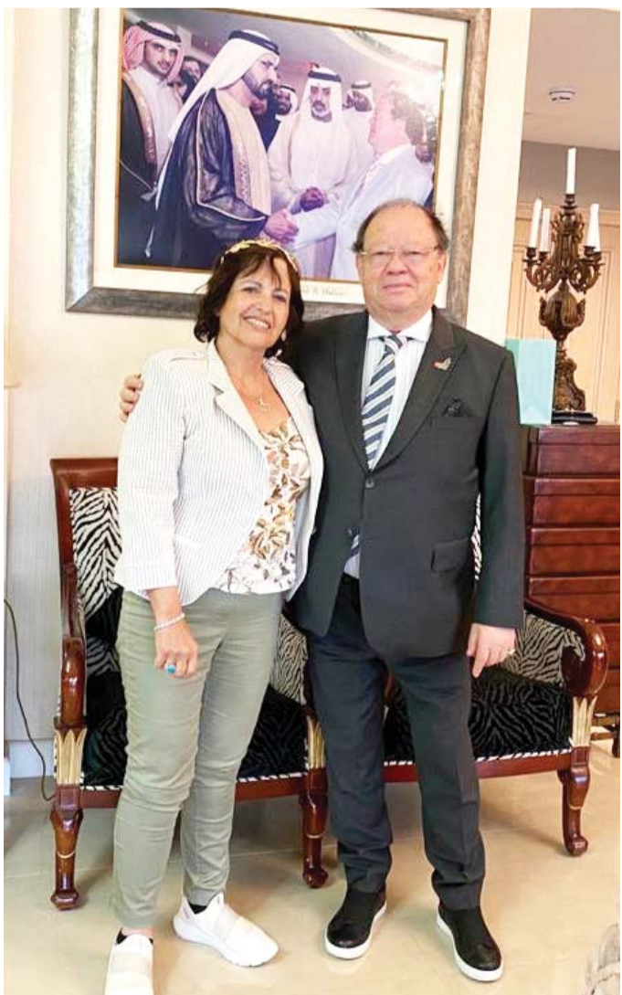
التقدم يكون بتحفيز الشباب

بدأ المؤلف الجزء الأول من كتابه بالحديث عن التاريخ والسكان والخصائص المجتمعية لصحراء الربع الخالي، من تقسيمات قنوية وقبائل وأعراف وغيرها من ملامح الإنسان والمكان، كالعادات والتقاليد والألعاب الشعبية والمعتقدات والقصص السائدة والمفردات اللغوية للبدو ودور المرأة وأهميتها في الحياة الاجتماعية. كما تطرق إلى مسميات أجزاء صحراء الربع الخالي وتاريخها وأصولها وعلاقتها بالأودية المنحدرة من جبال ظفار، مثل رملة الملحيت ورملة مقش، إلى جانب بعض الأجزاء في عرق الصحراء، مثل رملة غنيم ورملة الدكاكة، وكذلك النمط السكاني لهذه الصحراء،