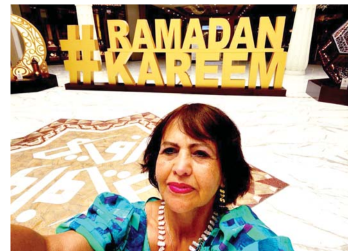
التسامح طريق إلى مستقبل أفضل

من يتعمق في فحوى المقولات لرجلي دولة سيدرك التشابه في الرؤية