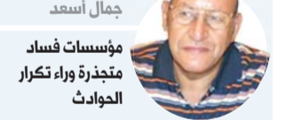
جمال أسعد مؤسسات فساد متجنزة وراء تكرار الحوادث

ووجدت الحكومة نفسها في موقف حرج، لأن إقالة الوزير قد تعرقل الخطط التي وضعها لتحسين مرفق السكك الحديدية، وهو ما ينطبق على وزير الصحة.