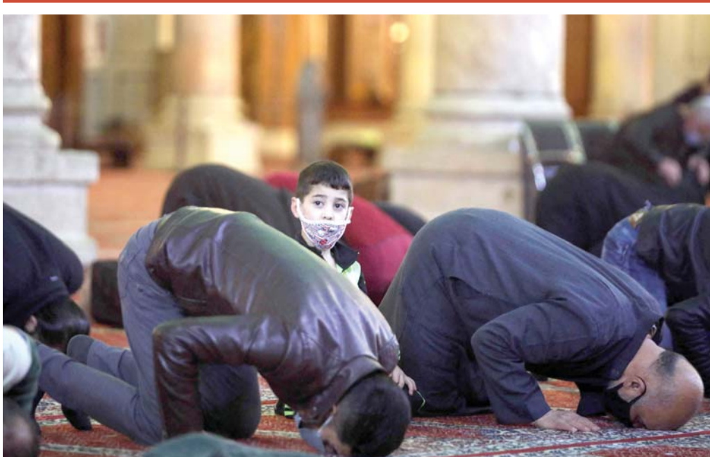
مسلمون يؤدون صلاة التراويح في شهر رمضان المبارك في الجامع الأموي بالعاصمة السورية دمشق

وأشارت عبود إلى أن هناك مفاوضات فعلية مع شركات إنتاج بغية