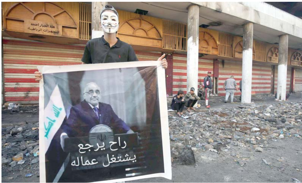
هل يرى العراقيون عبدالمهدي خلف القضبان

يذكر أن الشباب في العراق تعهدوا بالمضي قدما حتى تحقيق أهداف انتفاضتهم. ويشكل الشباب 60 في المئة من عدد سكان العراق البالغ 40 مليون نسمة. وتصل نسبة البطالة بينهم إلى 25 في المئة، بحسب البنك الدولي. ويعتبر شباب عراق أن ثورتهم هي فرصتهم الأخيرة لاسترجاع العراق من سارقيه الذين حولوه إلى "حظيرة خفية" لإيران.