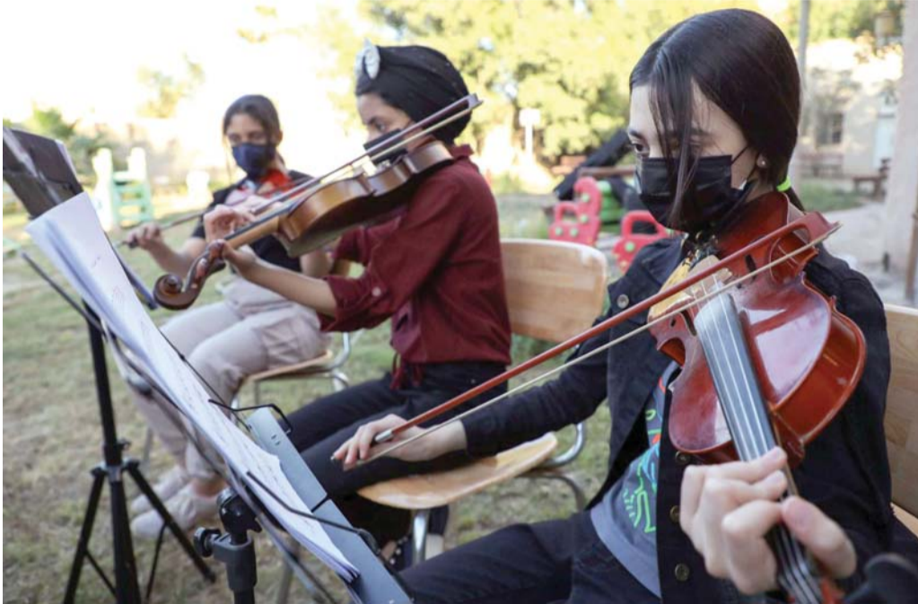
أوركسترا البصرة تعزف ألحان الماضي بسواعد غضة