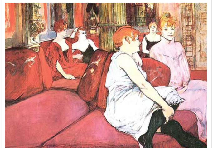
أجواء الطاحونة الحمراء كما رسمها هنري دي تولوز لورتريك

هناك مطعم يبيع الشاورمة يقع قريبا من ملهى الطاحونة الحمراء في حي بيغال بباريس. تأخذ وجبتك وتمشي. وكنت دائما أجلس مقابل الطاحونة الحمراء لأتناول وجبتي تلك. هل كنت أذهب إلى هناك من أجل الشاورمة اللذيذة أم من أجل التمتع بالنظر إلى ذلك الملهى الذي يذكرني بالفنان الانطباعي هنري دي تولوز لورتريك (1864 - 1901)؟ حين رأيت معرضا شاملا للرسم الفرنسي في تيت بريتان بلندن لم تخلط لوحاته براحة اللحم المشوي، تبين لي أن ما كنت أظنه حقيقيا لم يكن سوى وهم. يمكن النظر إلى لورتريك من غير التفكير في الشاورمة التي يمكن أكلها من غير التفكير في لورتريك. ما من علاقة بين الاثنين. وعلى العموم فإن الطاحونة الحمراء لم يكن سوى ملهى، أما أعمال لورتريك فقد سكنت المتاحف. العلاقة الوحيدة بين الاثنين يمكن العثور عليها في السينما. لورتريك كان هنا. هذا ما يقوله فيلم سينمائي.