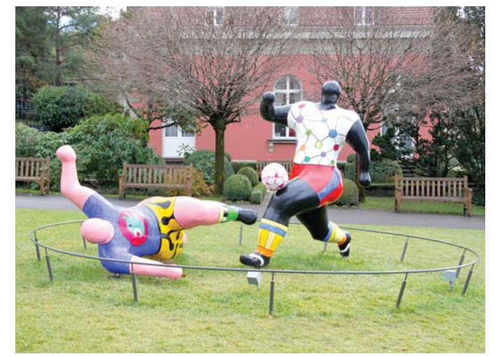
نساء يضاھين الرجال في القوة والبنية الجسدية

ولكن احتفى معرض متحف الفن الحديث بنيويورك وعنوانه «هياكل الحياة» بمسيرتها منذ الستينات، فإنه ركز بصفة خاصة على جانب التشييد