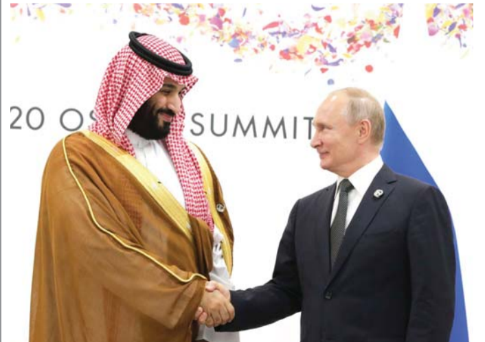
أرضية ممهدة للمزيد من التعاون

الرياض - أجرى ولي العهد السعودي الأمير محمد بن سلمان الخميس مكالمة هاتفية مع الرئيس الروسي فلاديمير بوتين تم خلالها التطرق لـ"قضايا الساعة الخاصة بالتعاون الروسي السعودي بما في ذلك التعاون في مجال حماية البيئة". وجاءت المكالمة في غمرة تكثيف الأمير محمد بن سلمان لاتصالاته ومبادراته بشكل ملحوظ متجاوزا الضغوط الخاصة بقضية مقتل الصحافي السعودي جمال خاشقجي. وتحافظ كل من روسيا والسعودية على علاقتي إنتاج وتصدير النفط على مستوى عال من التنسيق بشأن السوق العالمية للطاقة والحفاظ على توازنهما وتعديل أسعار الخام. لكن الطرفين ظلا خلال السنوات الماضية يعملان على توسيع العلاقات بينهما وخصوصا في المجال الاقتصادي. وقالت وكالة الأنباء السعودية الرسمية "واس" إنه جرى التطرق خلال الاتصال الهاتفي بين ولي العهد والرئيس الروسي إلى مبادرة الشرق الأوسط الأخضر التي أطلقها الأمير محمد بن سلمان مؤخرا وتهدف لرفع كثافة الغطاء النباتي وتعزيز كفاءة عمليات إنتاج النفط في تخفيف الانبعاثات الكربونية في العالم. وأضافت أن بوتين أبدى "ترحيبه بالمبادرة السعودية، مؤكدا دعم جهود