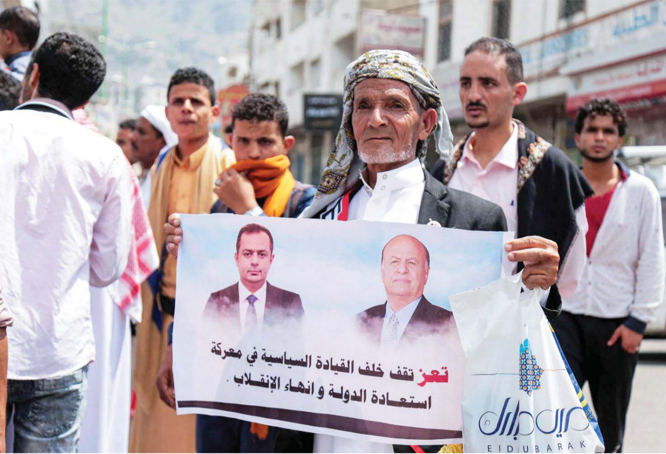
لا الدولة استعبدت ولا الانقلاب انتهى ولا المعيشة تحسنت