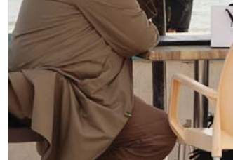
«13 نهج غاري بلدي» دراما بوليسية بلمسات أنثوية