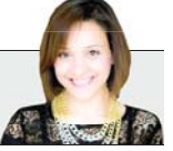
إنجب سمير كاتبة مصرية

استطاع الفنان المصري إدوارد أن يرسخ حضوره في الأدوار الاجتماعية التي جسدها على مدار العامين الماضيين منذ أن شارك في بطولة مسلسل «ولد الغلابة» ثم «البرنس» ونهاية بمسلسل «لؤلؤ»، وأعاد اكتشاف نفسه مجددا بعد أن ظل أسيرا لأدوار الكوميديا منذ بدء مسيرته الفنية.