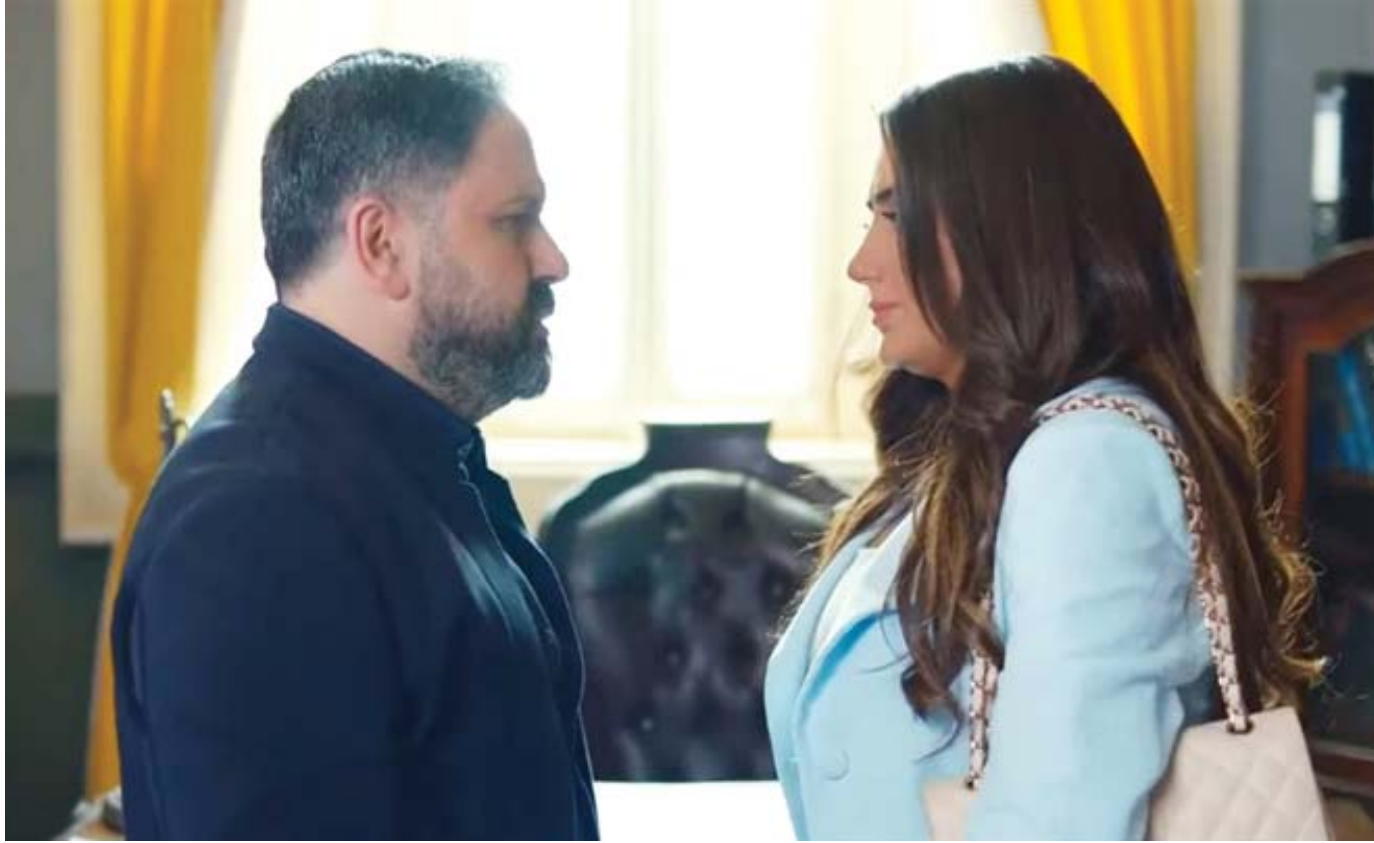
مسلسل «لؤلؤ» قدم إدوارد للجمهور بشكل مختلف

الفنان المصري يُعيد اكتشاف مواهبه التمثيلية بعيدا عن الأدوار الكوميدية