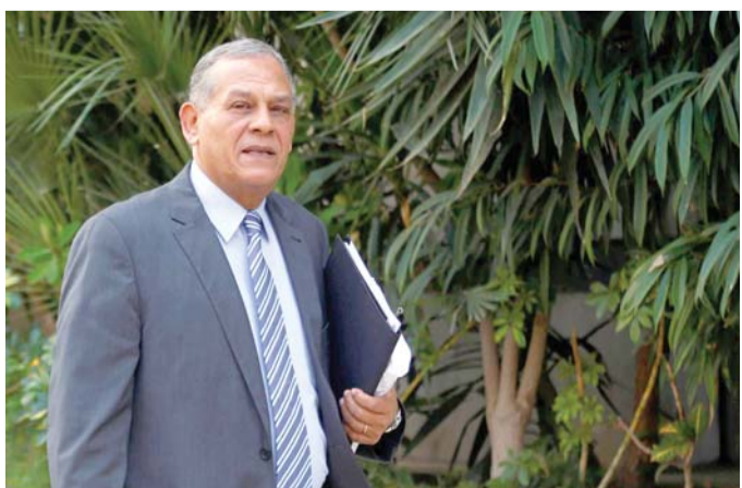
محمد أنور السادات يقود مبادرة للتواصل مع الشركاء الدوليين

وإلى خصومه أن تحركاته جاءت بإيعاز من بعض الأجهزة الرسمية، وهو ما فساه واعتبره مكابدة سياسية من بعض الأشخاص المحسوبين على جهات معارضة لإخفاقهم في تحريك هذا الملف على مدار سنوات.