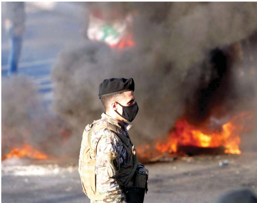
صامد في وجه الأزمات

حملة تشكيك منهجة تستهدف النيل من هبة المؤسسة العسكرية