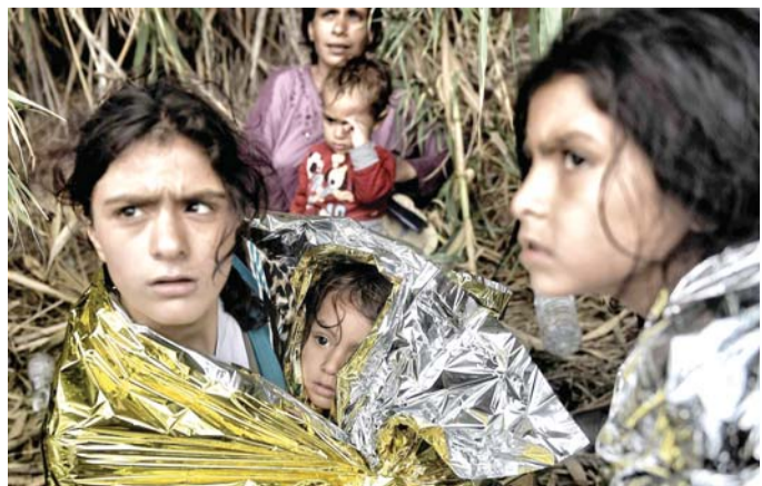
هل لنا من عودة

ram9410 # أقصى ما أتمناه أن أعود إلى وطني يوماً... أرجع إلى أحضانه وأعيد ترميم ركامه وأبدأ حياة أخرى جديدة... يوماً بعد يوم يزيد شوقي لمنزلي لوطني لحياتي هناك، حيث الأمان الداخلي الذي غاب بقدر ملامح وطني، موطني.. هل أراك سالماً متعمراً وغانماً مكرماً سوريا هل لي من عودة؟