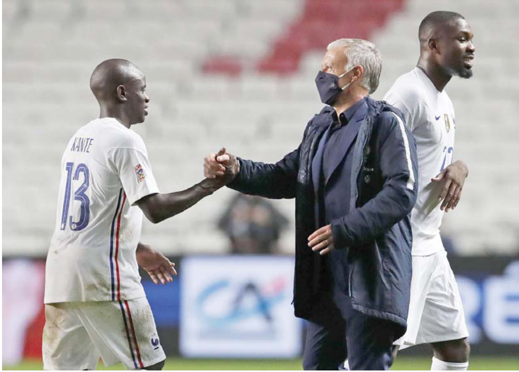
نحن على العهد

فرنسا تخوض حملة الدفاع عن لقبها وسط أزمة تحرير اللاعبين