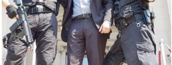
تشويق وإثارة لتقضي حقائق غامضة