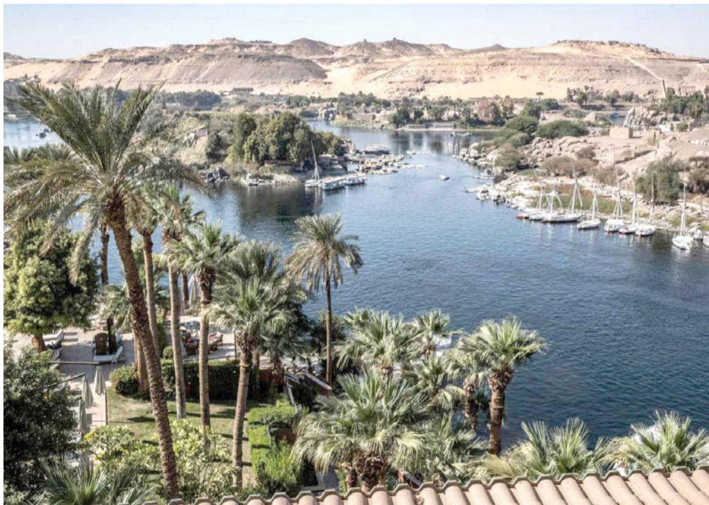
نهر النيل.. منبع الحياة

حكايات قديمة وجديدة عن شريان الحياة في مصر