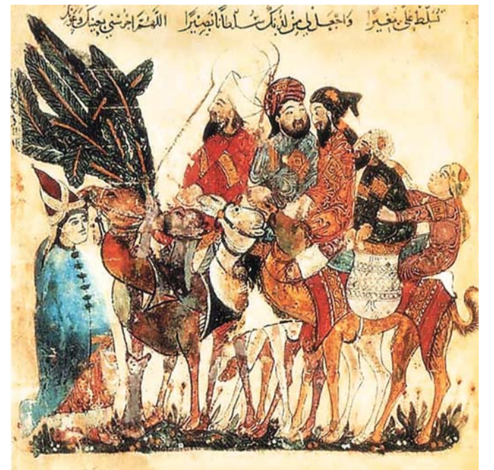
مشروع غاية في التنوع والشمولية

اعتادت ثقافتنا، ومنذ القرن العاشر الذي ألف فيه الكتاب، وربما أبعد بكثير، بسان كل مجهول النسب هو مجهول العواقب والمصائر، لذلك استنكر الجميع هذا الكتاب الذي يضم 52 رسالة، وكأنه يضم 52 مصيبة في التفكير والمنطق العلمي والنطق الأدبي والنهج السياسي.