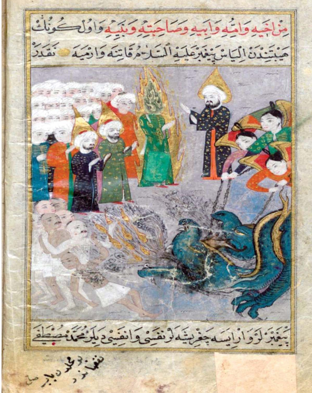
محظور الدين والسياسة ومنظور العلوم والأفلاك في رسائل ملفزة

مؤلفون مجهولون استبقوا من جاء قبلهم وأدهشوا من أتى بعدهم