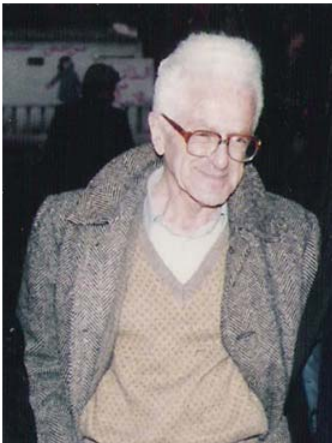
كاتب اختار العزلة وأنصفه التاريخ

ويقترح الكتاب حوارا أنجز سنة 2017 مع المخرج أحمد راشدي حول فيلم "الأفيون والعصا" المقتبس من رواية معمرى.