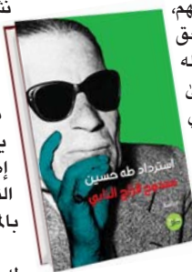
استرداد لطة حسين من الأيادي التي عبثت بترائه وأفكاره، دفاعا عن القيمة لا عن الشخص

وبالمثل كان أعداؤه باخترالهم فكره وحصره في دائرة ضيقة، بل وأشهرها سهامهم ونبالهم، دون أن يعطوا لأنفسهم فرصة للتفكير والابتعاد عن الفكر الأحادي الذي خندقوا فيه الرجل، حتى من عاد إلى صوابه منهم، وارتأى في الرجل ما يستحق أن يتناوله بالدرس، أساء له بقدر ما أحسن إليه، على نحو ما فعل الفكر الإسلامي الدكتور محمد عمارة وحاول تمريره في كتابه "من الانتصار بالغرب إلى الانتصار للإسلام" (2014)، إذ تخيل أن طه حسين مرتد فسعى عبر كتابه إلى استعادة طه حسين إلى صفوف الإسلاميين، حيث وجد أن العميد تأسلم عندما تقدم به العمر، بل