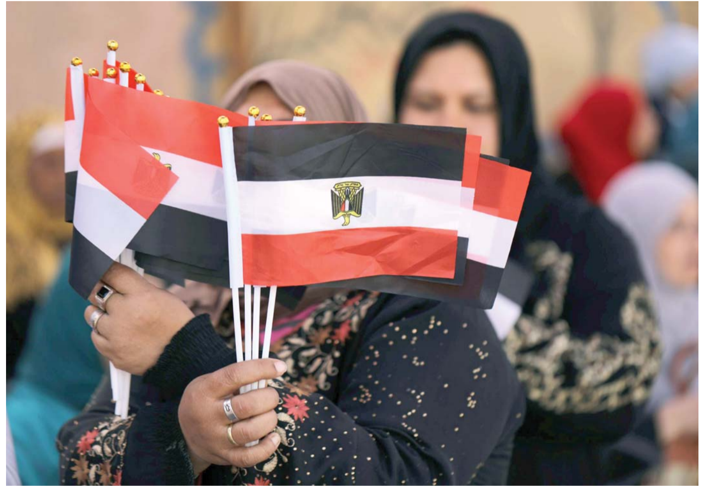
المرأة المصرية مسؤولة ومعيلة وربة أسرة

تسريبات لمواد مشروع قانون الأحوال الشخصية تثير موجة غضب على مواقع التواصل