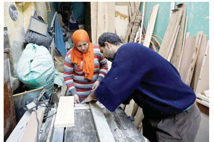
الحرف الصغيرة لا تجد حظوظها

ونقلت وكالة الأنباء الجزائرية الرسمية ذلك عن وزير العمل والتشغيل الهاشمي جعوب خلال زيارة له إلى ولاية الشلف غرب البلاد. وحسب وزير العمل فقد تم فقدان 51 ألف وظيفة العام الماضي، بسبب غلق مصانع لتجميع وتركيب السيارات