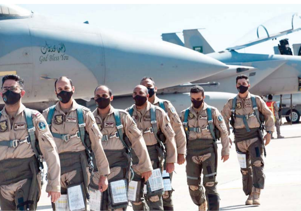
قوة سعودية على ضفاف المتوسط

ارتفاع مصري لضغط سعودي للحد من تمدد تركيا في شرق المتوسط