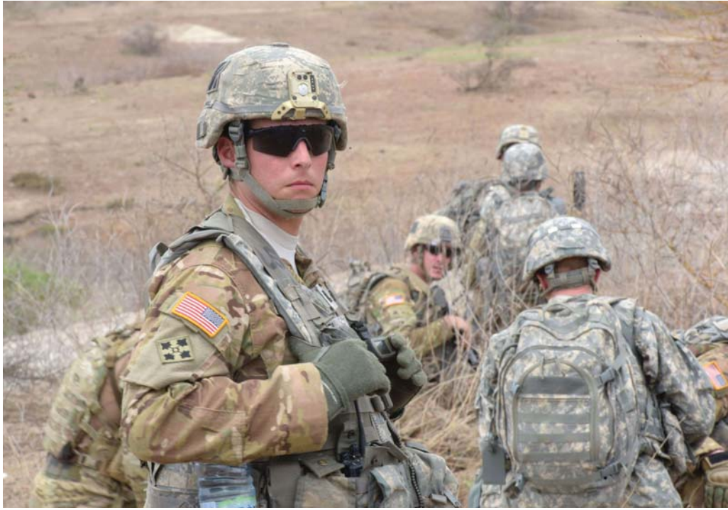
تقليص القوات الأميركية في أفريقيا مغامرة

الولايات المتحدة تدرج فرعي داعش في موزمبيق والكونغو على قوائم الإرهاب