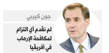
جون كيربي لم نقدم أي التزام لمكافحة الإرهاب في أفريقيا

ومنذ أن قررت إدارة الرئيس السابق دونالد ترامب سحب القوات الأميركية من الصومال، بينما لا يزال نشاط هذه التنظيمات قائما وبشكل تهديدا للمصالح الأميركية في القارة، يُعلق القادة الأفارقة الكثير من الأمل على إصلاح إدارة بايدن ما أفسدته إدارة ترامب في إهمالها للقارة الأفريقية.