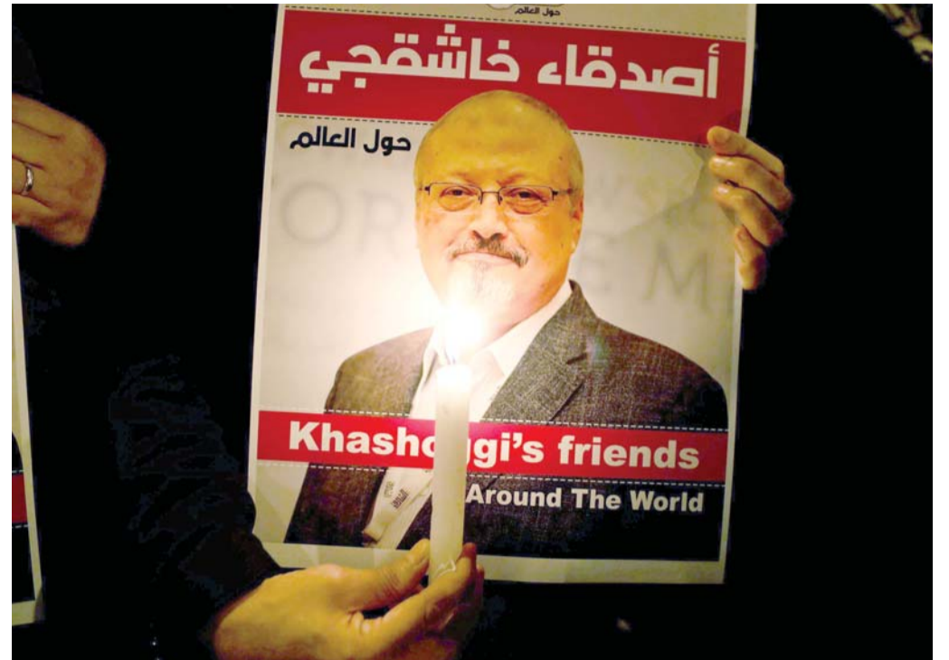
أصدقاء خاشقجي تجمعهم المصلحة

ويعتقد الخبراء أن زوكربيرغ قد استخدم تطبيق "كلوب هاوس" لاستطلاع المنافسة في مبادرة لشركته الجديدة، فبعد لحظات من انتشار أخبار ظهوره المفاجئ على "كلوب هاوس" امتلأ موقع تويتز