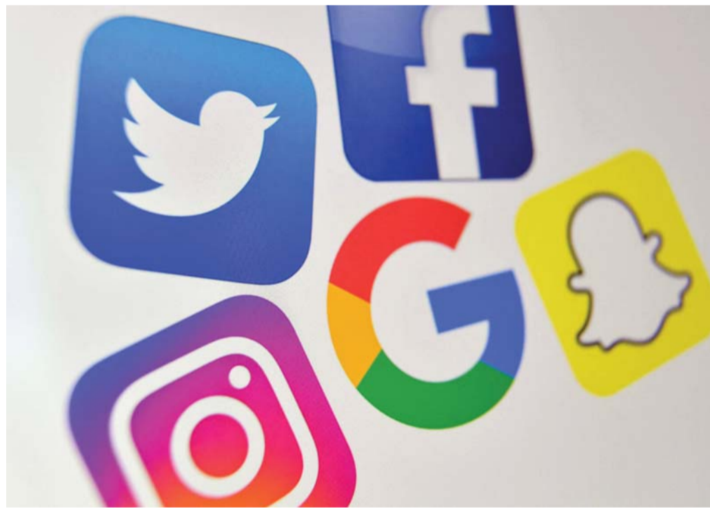
عودة الأصوات الضائعة

@TurkiHalhamad1 #مؤكد أنك لم تنس أحداً.. اللي ببالك ليسوا إلا قاعدة عسكرية أميركية وأخرى تركية وامتداد لملاي إيران في الخليج للأسف. كانت "العلاء" فرصة، ولكن أبوطيبي ما يخلي طيبه.