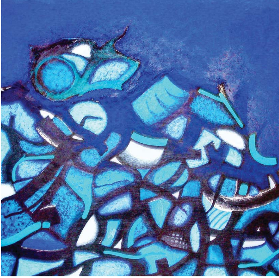
الفن رسالة جمالية

أمنة النصيري: الفن ليس شعارات وملصقات موجهة