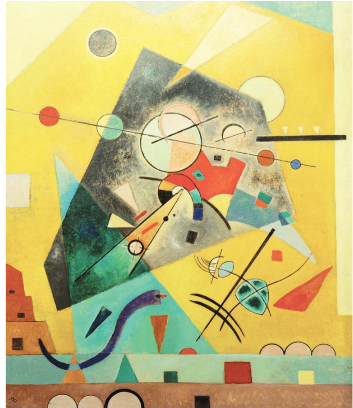
لوحات فتحت المستقبل على استعارات كثيرة

وكان لتلك الأعمال البعيدة عن الواقع، فضاء تجول فيه بحرية، على الرغم من اشتقاق أشكاله منه واستعمال الخصائص التعبيرية الداخلية للون