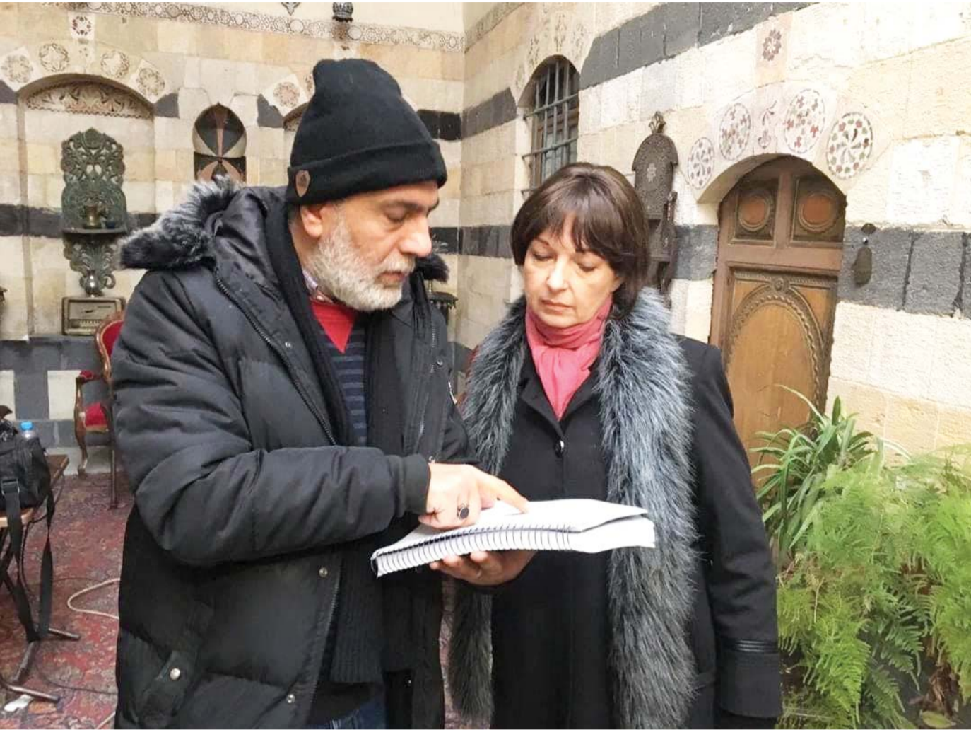
من أجواء تصوير الجزء الثاني من «بروكار»