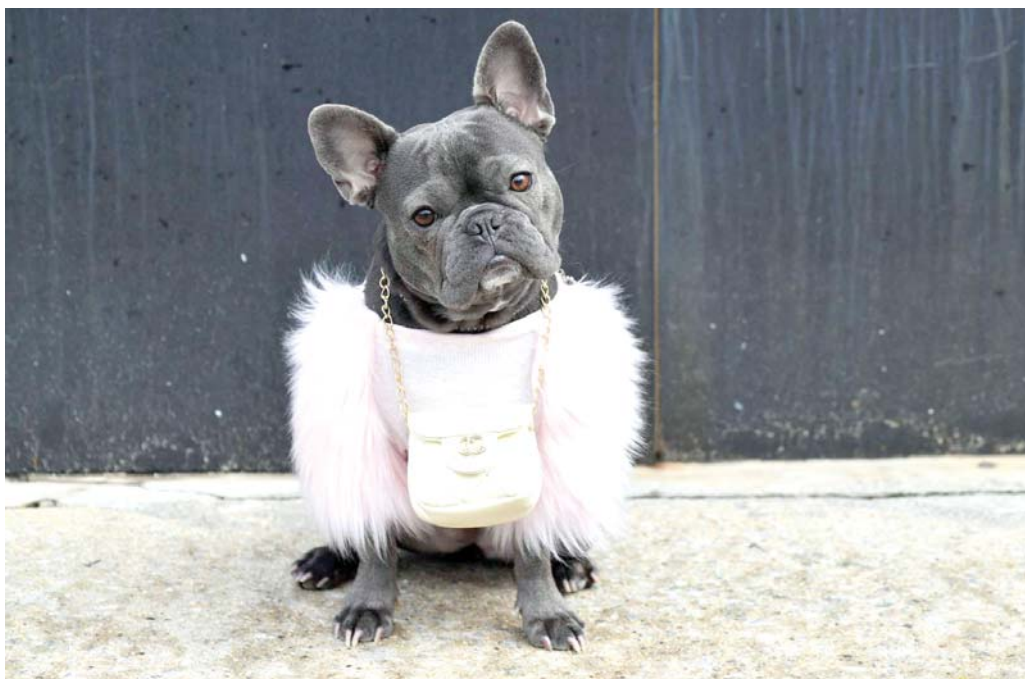
كلية من سلالة البولودوغ الفرنسي تدعى "ماغوليا" ترتدي بدلة من تصميم شانيل تقف خارج استوديو "سبرينغ" خلال أسبوع الموضة في نيويورك.

وأكد جيان مارك أيوبي رئيس قسم الطب النسائي والتوليد في مستشفى فوش في منطقة سورين بضاحية باريس أن "الأم وطفلا بصحة جيدة" وأن الولادة تمت دون أي مضاعفات كبيرة. وولدت الطفلة وهي تزن 1.845 كيلوغرام (4.059 رطل) يوم الجمعة.