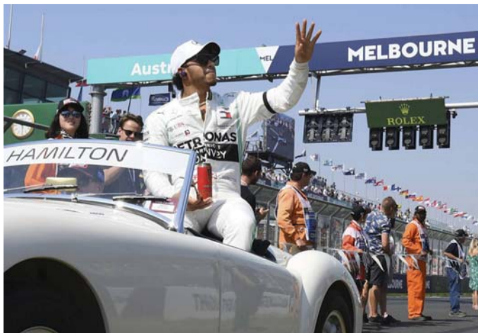
دائما على العهد

وأشار دومينيكيالي إلى أنه لن يتحدث إلى مروجي السباقات يوميا ويتمن أن يكون الوضع الحالي مستقرا في النصف الثاني من 2021. وما زال وضع سباق الصين غير مؤكد. وتابع دومينيكيالي "الصين مهمة جدا بالنسبة إلينا وأبلغتنا الحكومة بانها لن تستطع استضافة أي حدث دولي حتى الصيف المقبل".