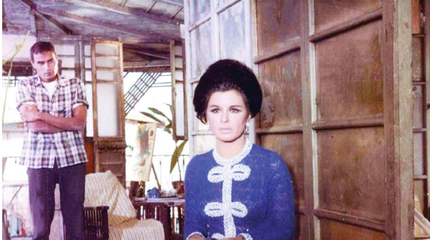
«الاختيار» واحد من أهم الأفلام التي شارك فيها العلايلي