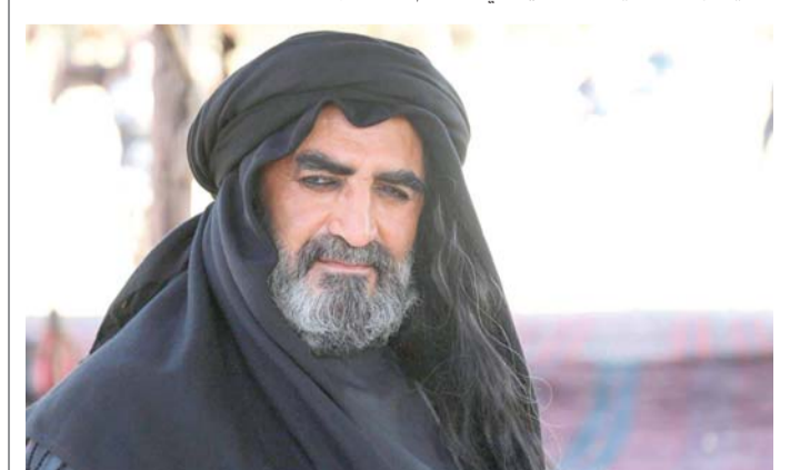
«غليص» علامة فارقة في الدراما البدوية